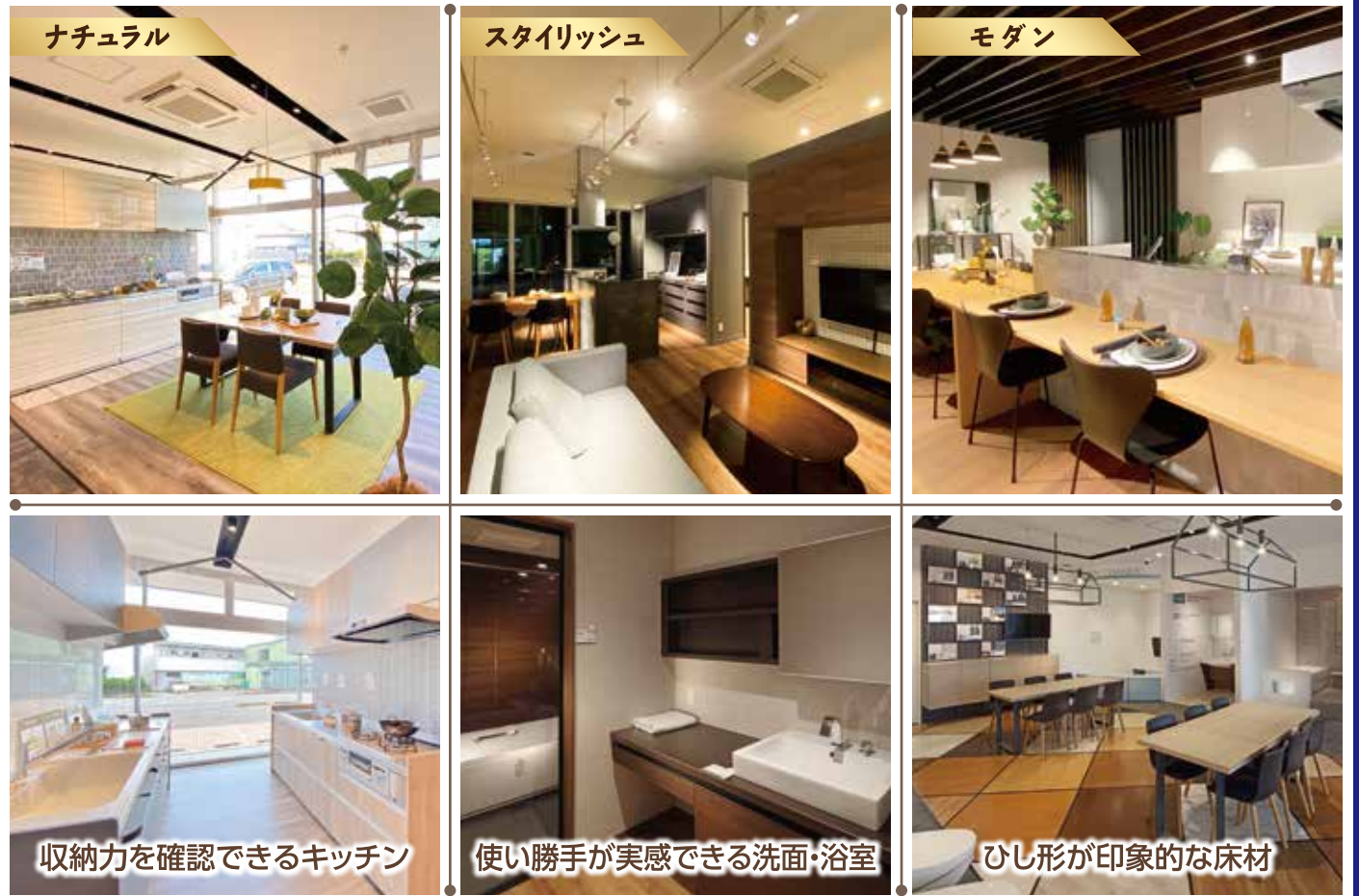
収納力を確認できるキッチン